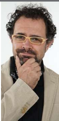
MAGO MORE Experto en gestión del cambio