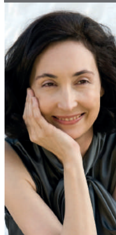
ELSA PUNSET Experta en educación e inteligencia emocional aplicada al cambio

Pequeñas revoluciones para la vida y el trabajo